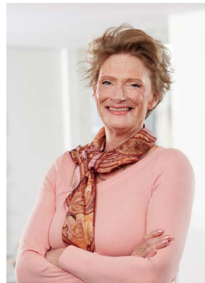
Alida Oppers Inspecteur-generaal van het Onderwijs

In De Staat van het Onderwijs schrijven we elk jaar over de kwaliteit van het onderwijs in Nederland. In dit jaarverslag verantwoorden we ons eigen werk in het afgelopen jaar. Dit doen we in de vorm van een beschrijving van de grote ontwikkelingen in ons toezicht, een overzicht van onze stelselonderzoeken en aantallen onderzoeken bij scholen en opleidingen en besturen.