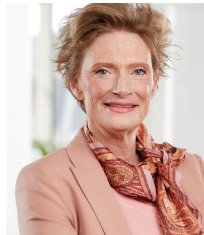
Alida Oppers Inspecteur-generaal van het Onderwijs

Kortom, goede schoolexamens, zorgvuldig georganiseerd en op tijd afgerond. Als eindexamenleerling zou je dat toch ten minste mogen verwachten?