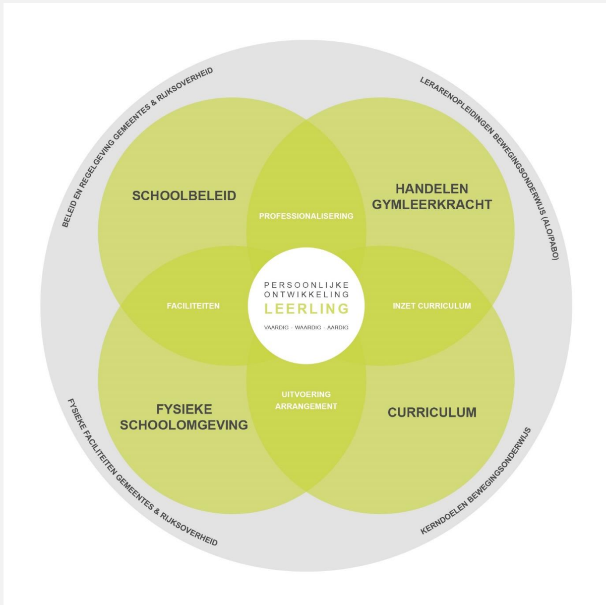
Figuur 2. Conceptueel model bewegingsonderwijs

Op basis van de inbreng van de deskundigen tijdens de panelbijeenkomst is het eerste inhoudelijk kader bijgesteld en verder uitgewerkt in concrete doelen en prestatie-indicatoren. Hierbij is de eerste indeling in de drie dimensies leerling, leerkracht en leeromgeving verder gespecificeerd naar een indeling in vijf dimensies: persoonlijke ontwikkeling van de leerling, handelen van de gymleerkracht, schoolbeleid, curriculum en fysieke schoolomgeving. Deze vijf dimensies zijn opgenomen in het conceptueel model bewegingsonderwijs in Figuur 2. Het bijgestelde inhoudelijke kader is als tussenproduct opgenomen in Bijlage 4.