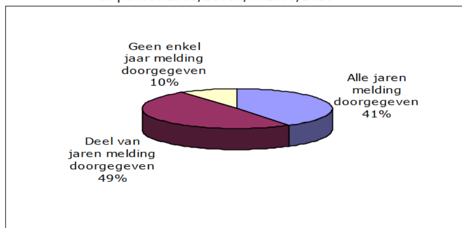
Grafiek 4.2 Aantal jaren waarin scholen onderwijs verzorgen versus aantal jaren waarvoor zij geen schorsingen en verwijderingen hebben doorgegeven in de periode 2005/2006 t/m 2009/2010

In de afgelopen vijf schooljaren heeft 41 procent van de vestigingen voor alle jaren waarin zij onderwijs aanboden schorsingen en verwijderingen doorgegeven aan de inspectie. In diezelfde periode heeft 10 procent van de vestigingen in geen enkel jaar dat zij onderwijs aanboden een schorsing of verwijdering gemeld.