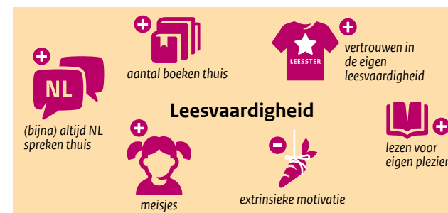
Figuur 2. Samenhang tussen leesvaardigheid en leerlingkenmerken in bo en sbo.

Eindnoot: zie ook de technische toelichting bij deze factsheet en www.peilpunt.nl .