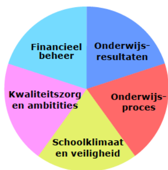
Vijf kwaliteitsgebieden primair, voortgezet en speciaal onderwijs

naar deze fasering kijken. Hierin proberen we of het mogelijk is om af te zien van gedetailleerde indicatoren. Het waarderingskader kent nu circa 20 brede standaarden (zie bijlage), gegroepeerd in vijf of zes kwaliteitsgebieden: