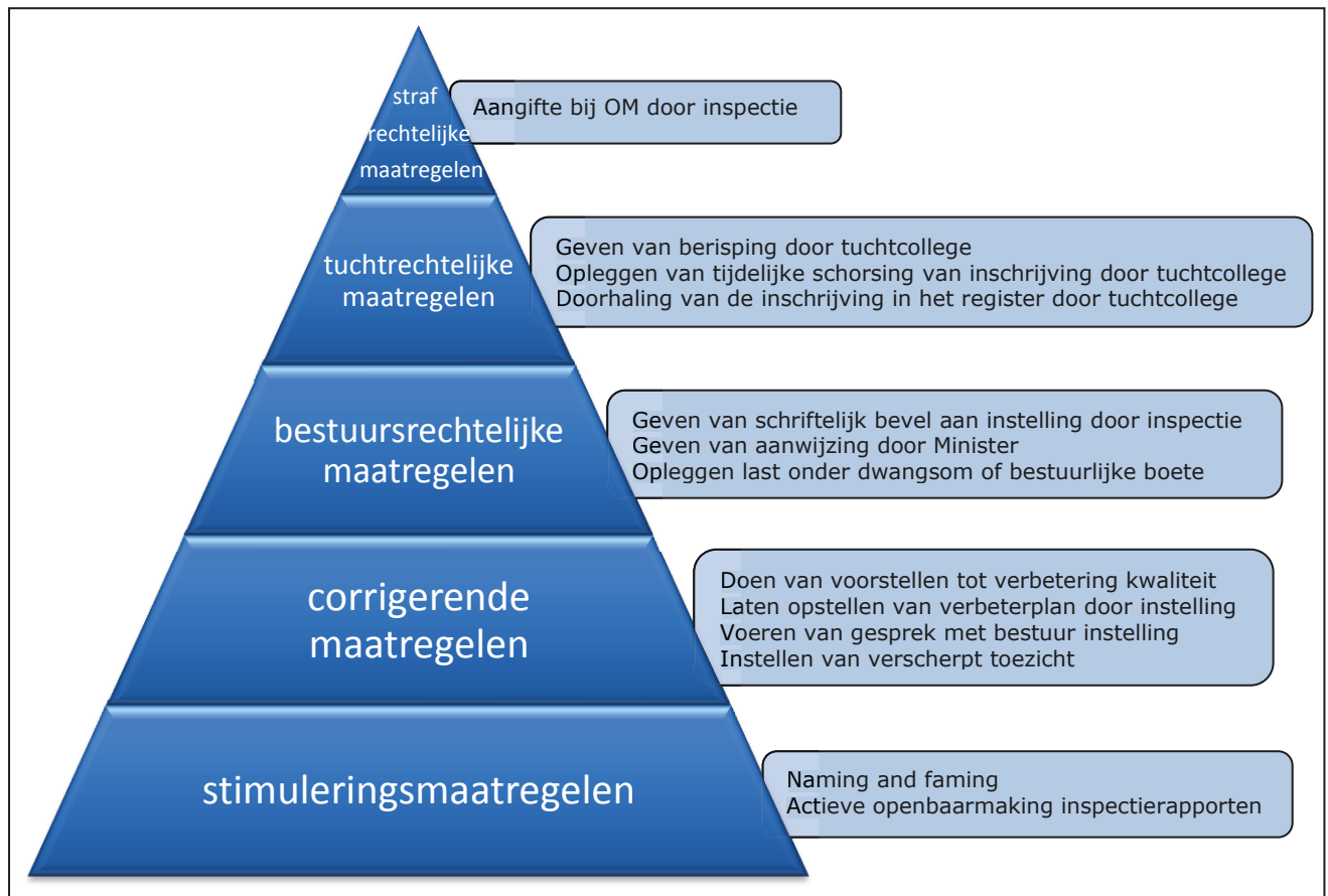
Figuur 3: interventiepiramide

Bestuursrechtelijke maatregelen zijn interventies die tot doel hebben een tekortkoming ongedaan te maken. Dit geschiedt door toepassing van wettelijke dwangmiddelen door de inspectie.